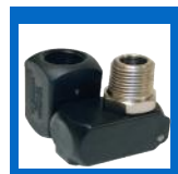
Adapteur tournant pour outils à air