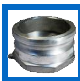
Adapteur mâle x femelle NPT