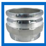
Adapteur mâle x mâle NPT