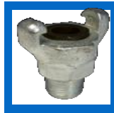
Adapteur mâle x mâle NPT