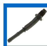
ATS1212H 1/2" hose barb