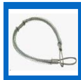
WSR-2 Câble de retenue, boyau à air sur machine