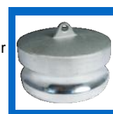
Bouchon protecteur "dust cap"