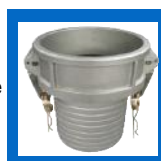
Embout femelle à boyau