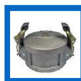
CAP protecteur "dust cap"