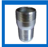
Embout à boyau "Combinaison nipple"