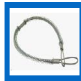
WHIP-L Câble de sécurité, boyau à air, long, 1/2" à 3"