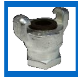
Connecteur femelle x femelle NPT