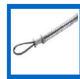
WHIP-S Câble de sécurité, boyau à air, court, 1/2" à 1 1/4"