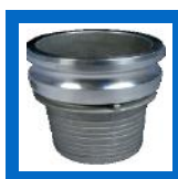
Embout mâle à boyau