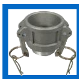
Connecteur femelle x mâle NPT