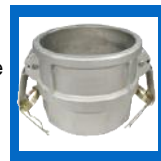
Connecteur femelle X femelle NPT