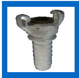
Embout à boyau type universel